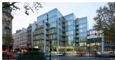
Moderne. A Vavin, dans le 6e arrondissement, ce domino de verre abrite le nouveau siège parisien de La Française.

Grand cru. L'année 2015 aura été un grand cru pour le marché de bureaux parisien. Avec plus de 950 000 mètres carrés placés l'an dernier, le volume de transactions a bondi de 15 %. Il représente 43 % du marché francilien, contre environ 35 % durant les années précédentes. « L'intense activité des six arrondissements du quartier central des affaires (450 000 mètres carrés, + 18 %) a joué un rôle de locomotive vers le cœur de ville », souligne Loïc Cuvelier, directeur de la location de bureaux parisiens chez BNP Paribas Real Estate. « Le long de la rive droite, les arrondissements centraux proches de l'Opéra font désormais jeu égal avec le secteur de l'Etoile, qui perd sa suprématie », ajoute Alexandre Fontaine, son homologue chez CBRE. Les PME se révèlent particulièrement dynamiques parmi les sociétés ayant pris des surfaces à bail en 2015 : + 11 % pour celles inférieures à 1 000 mètres carrés, + 18 % entre 1 000 et 5 000 mètres carrés.