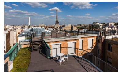
Transfert. L'entreprise informatique One Point a quitté Boulogne pour l'immeuble Steel à Paris 16e.