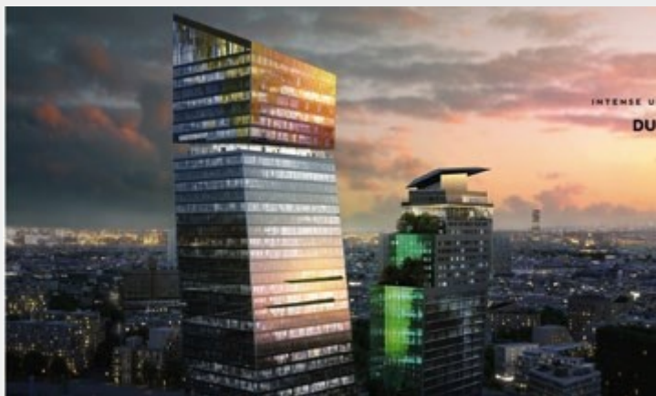
Projet. Les tours Duo à Paris Rive gauche.